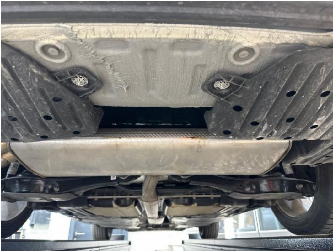
(23.) Beschreibung: v (Unterboden hinten)