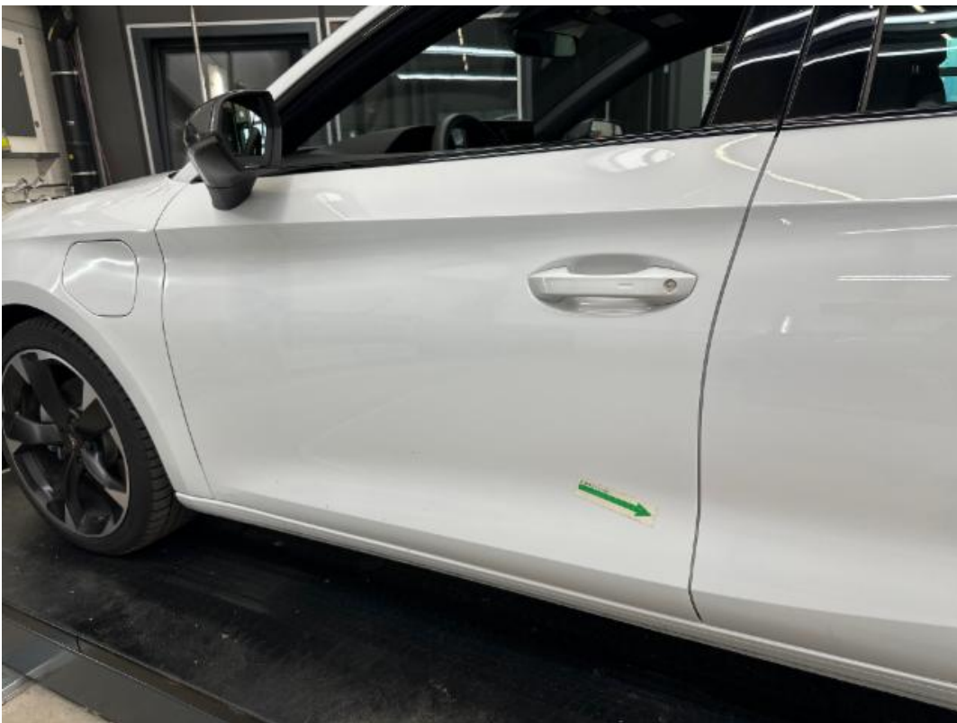
(36.) Beschreibung: 20