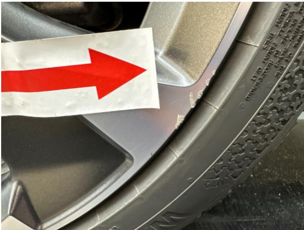
(26.) Beschreibung: 08