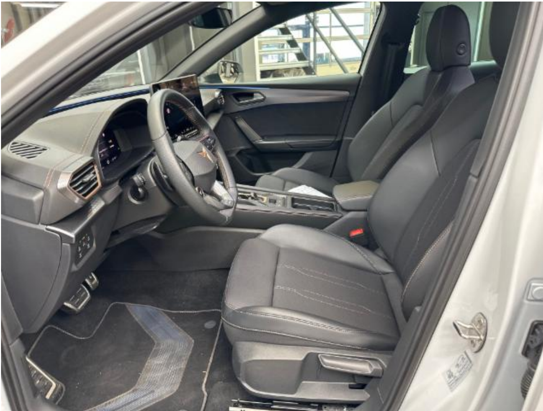
(13.) Beschreibung: i (Türöffnung vorne links)