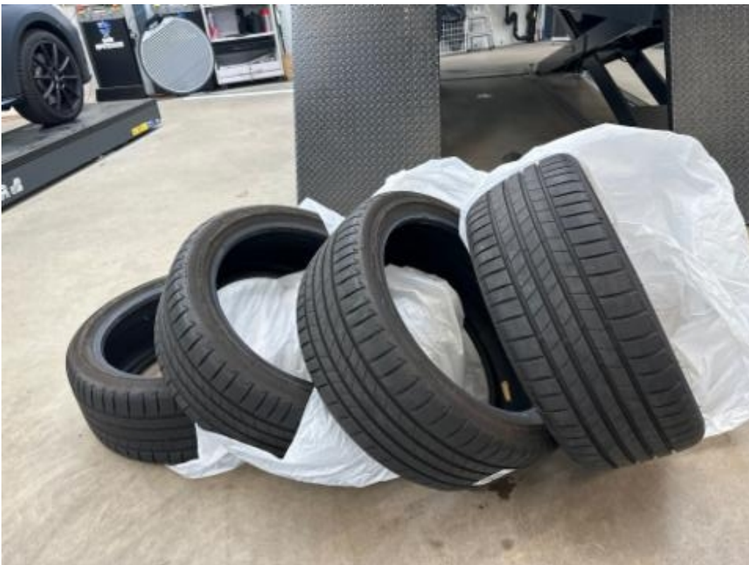
(24.) Beschreibung: w (Reserveräder /Reservepneus (sind zusätzliche Räder oder Reifen))