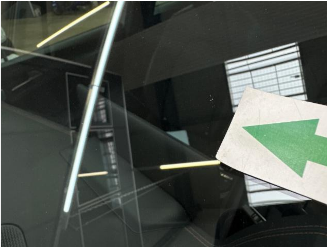
(39.) Beschreibung: 03