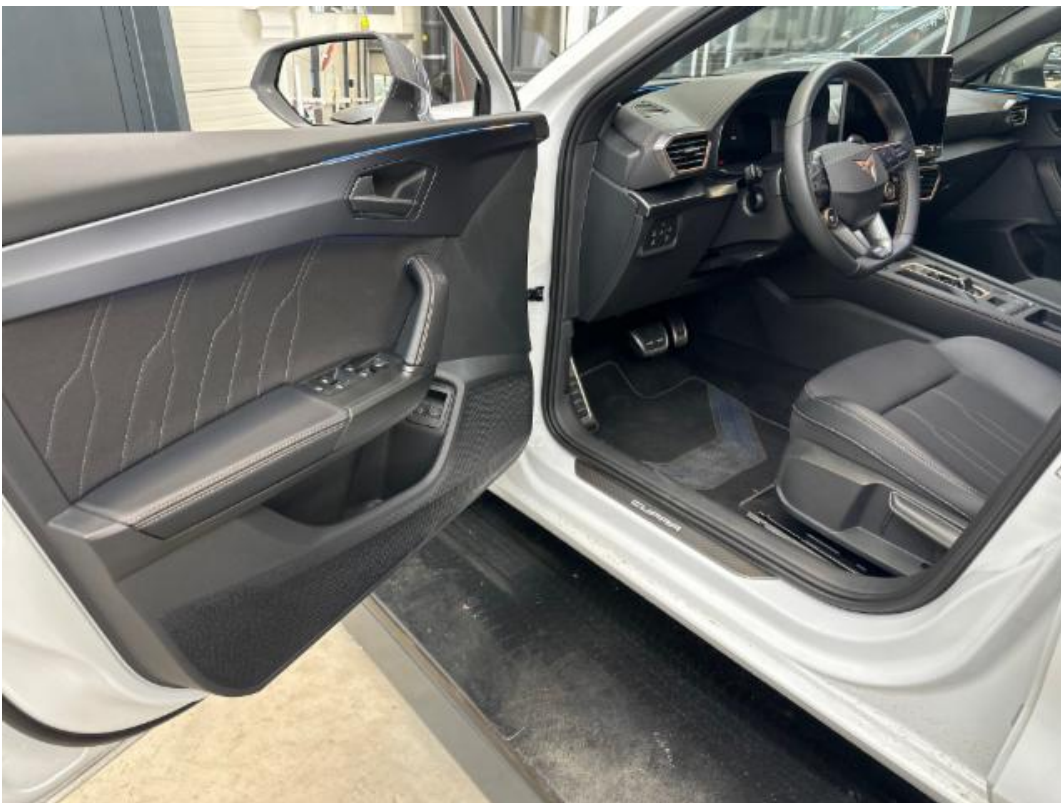
(40.) Beschreibung: 84