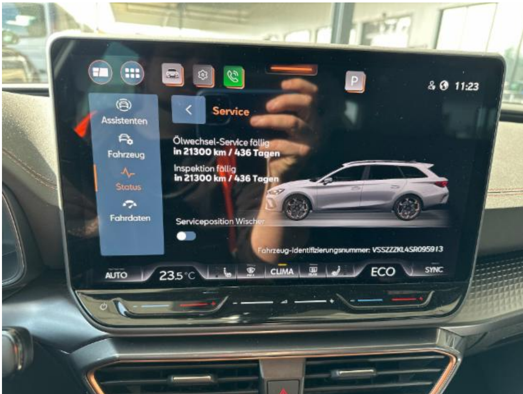
(9.) Beschreibung: g (Armaturenbrett mit Serviceanzeige bei laufendem Motor)