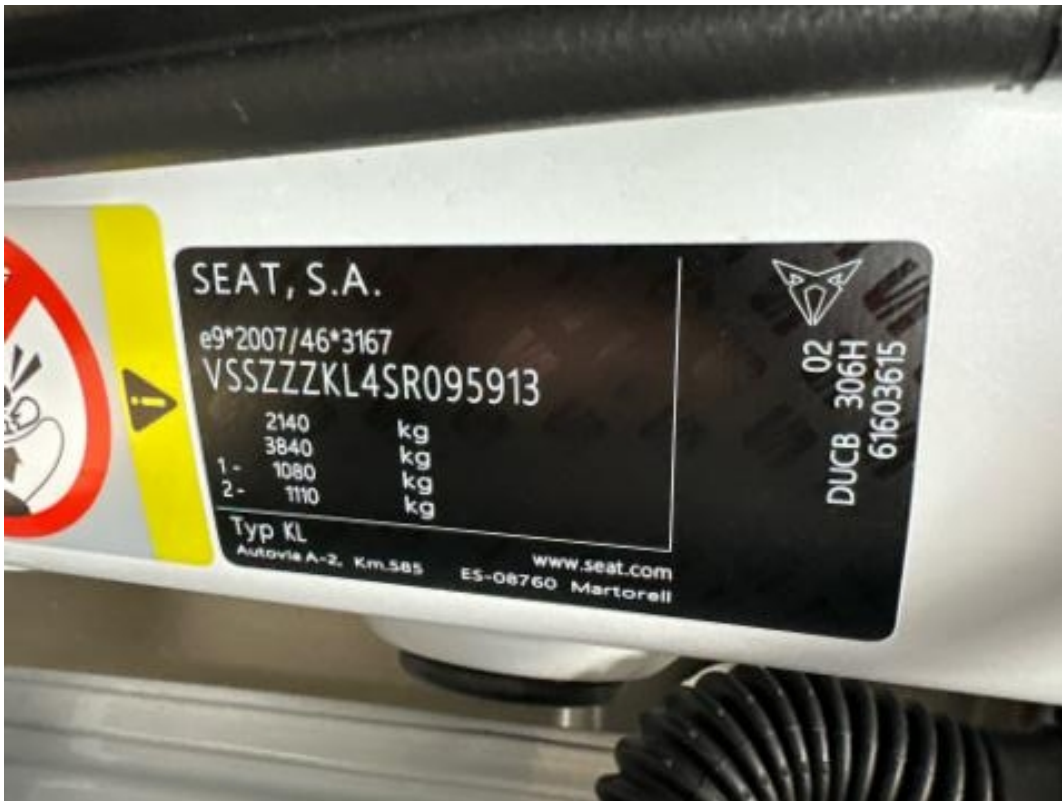
(7.) Beschreibung: e (Fahrgestellnummer/Typenschild am Fahrzeug)