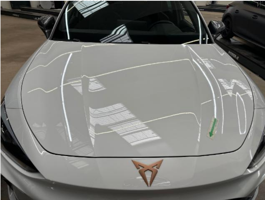
(31.) Beschreibung: 02