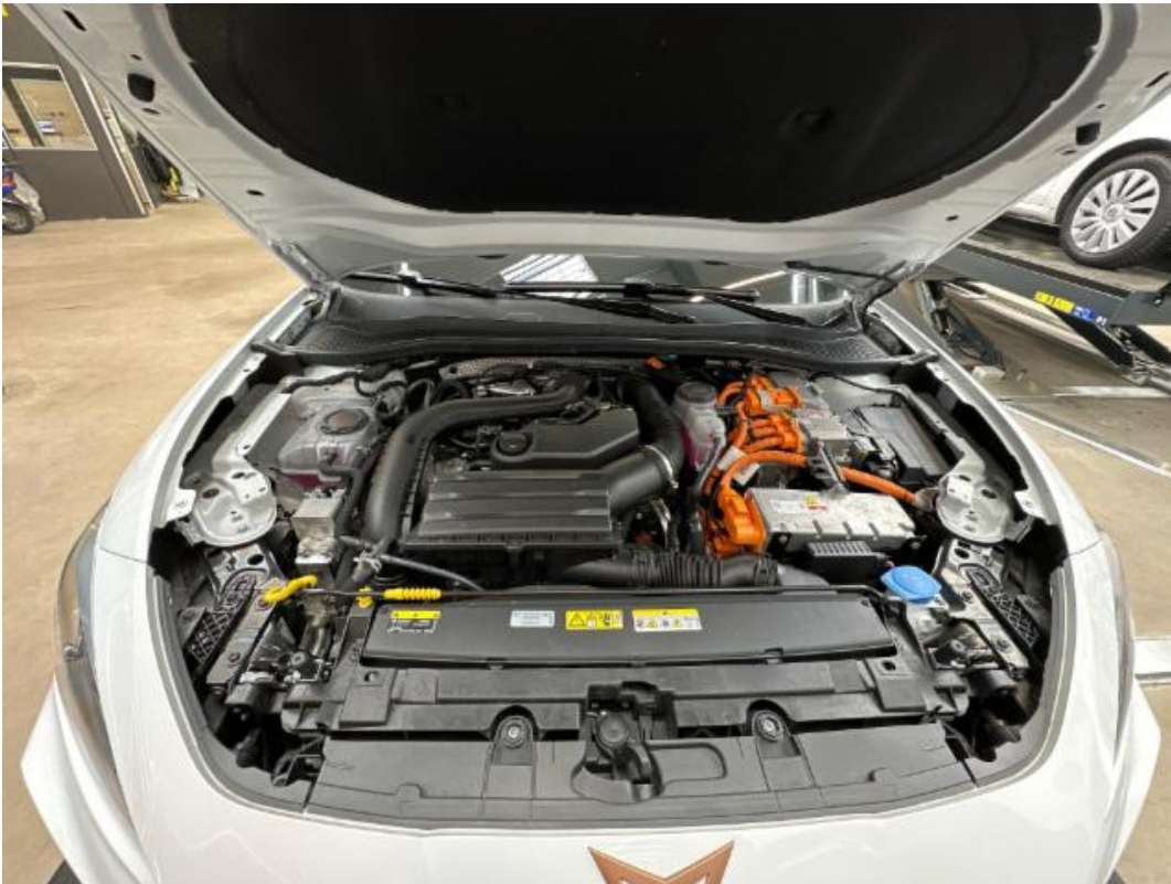
(21.) Beschreibung: t (Frontklappe geöffnet)