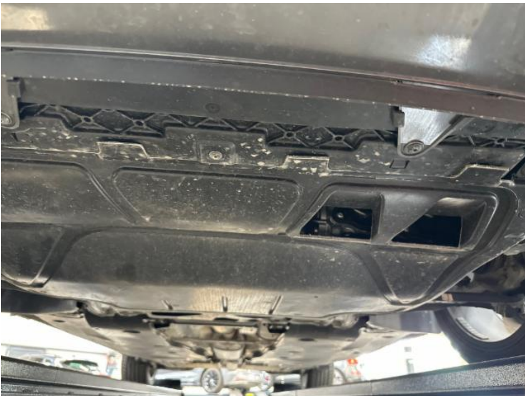
(22.) Beschreibung: u (Unterboden vorne)