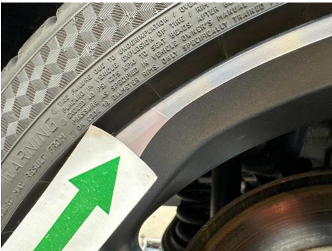
(28.) Beschreibung: 15