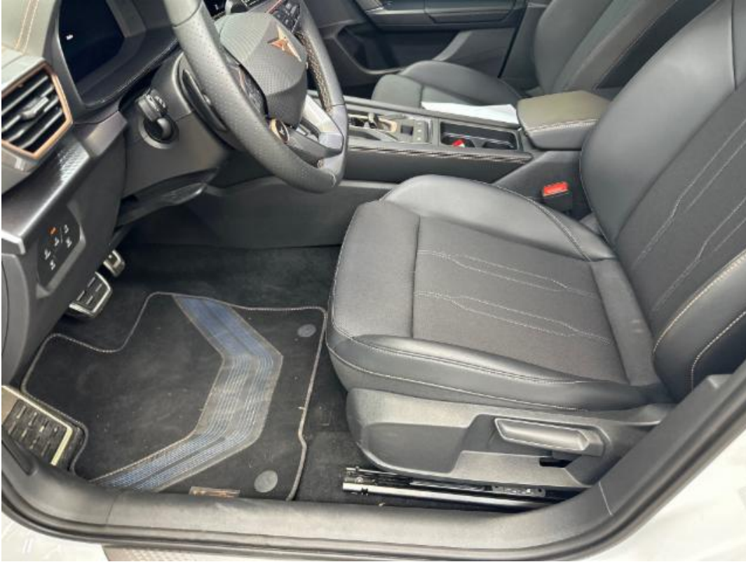
(41.) Beschreibung: 84