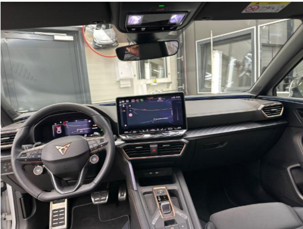
(14.) Beschreibung: j (Armaturenbrett-Übersicht von Rückbank aus)