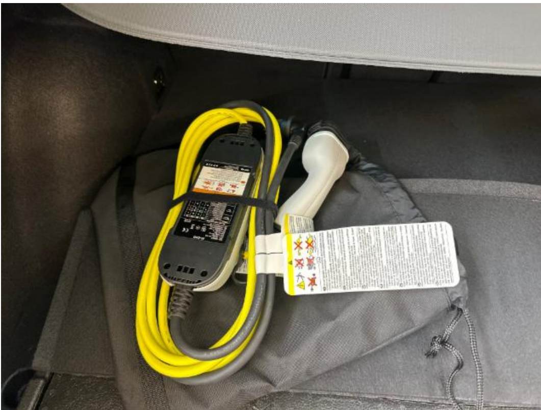
(18.) Beschreibung: q (Ladekabel bei Elektrofahrzeugen)