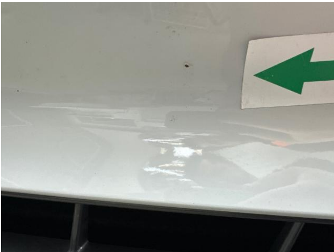
(30.) Beschreibung: 01