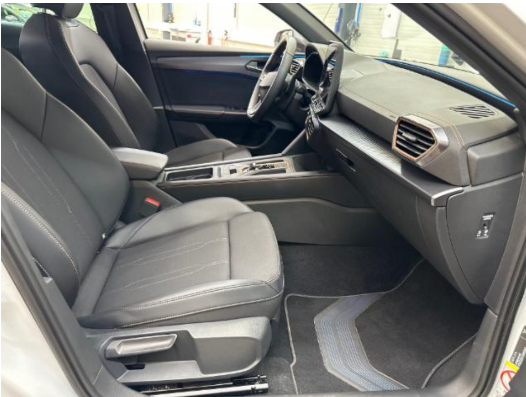
(20.) Beschreibung: s (Türöffnung vorne rechts)