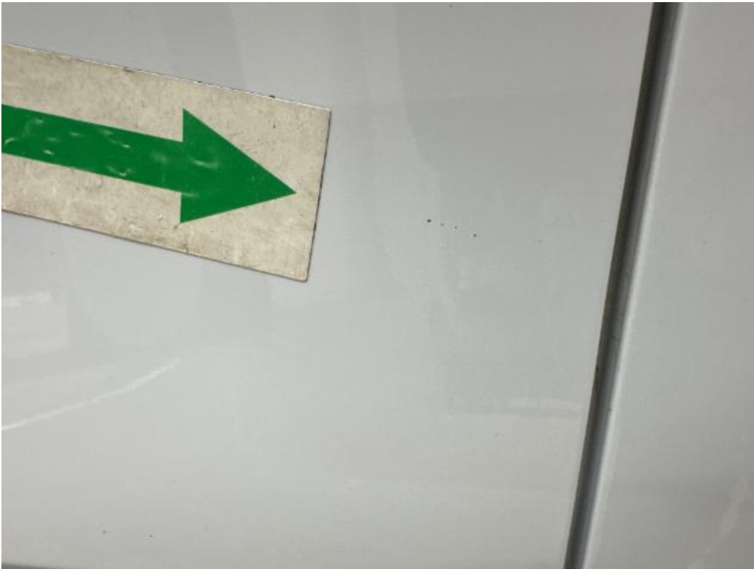
(37.) Beschreibung: 20