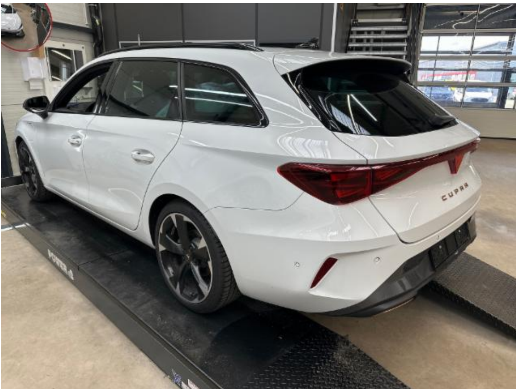
(4.) Beschreibung: c (Diagonal hinten links – ganzes Fahrzeug)