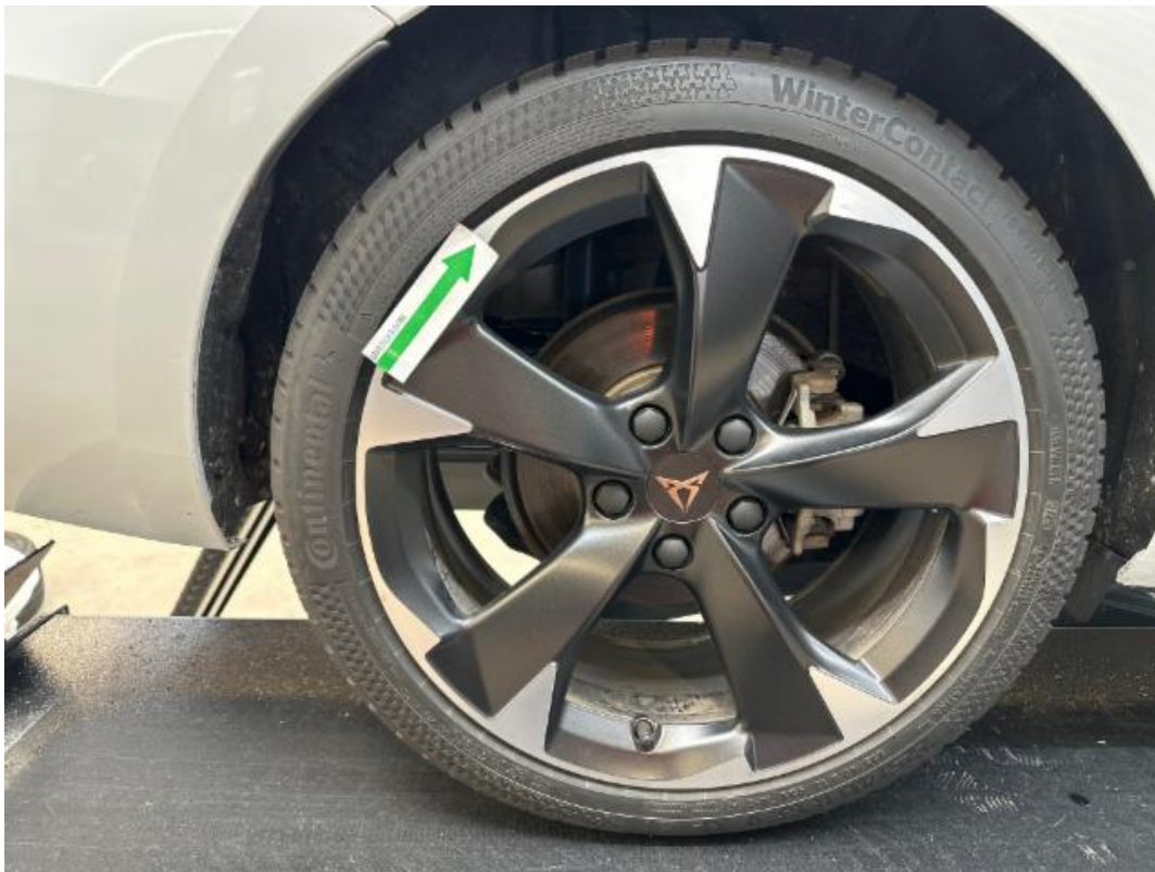
(27.) Beschreibung: 15