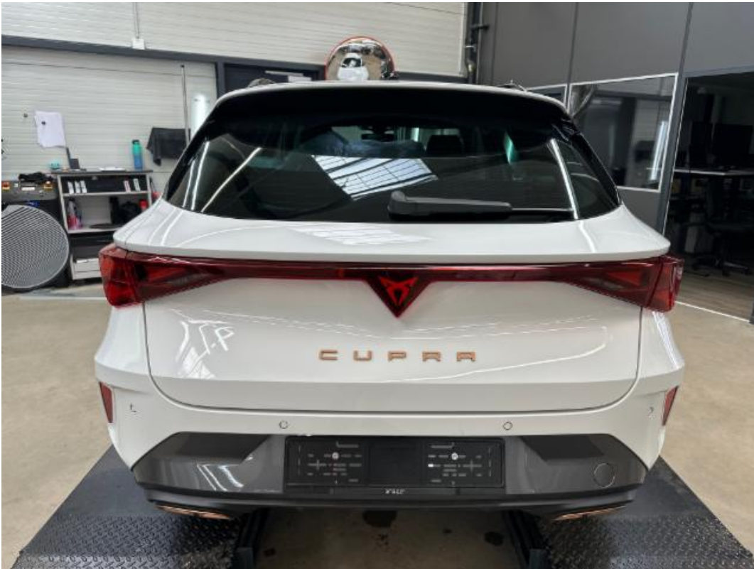
(5.) Beschreibung: cc (Heck)