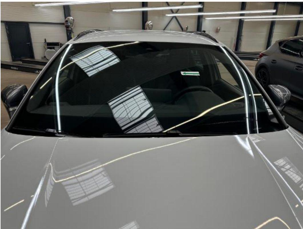
(38.) Beschreibung: 03