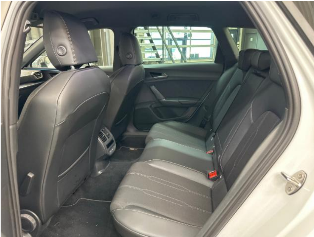
(15.) Beschreibung: k (Türöffnung hinten links)