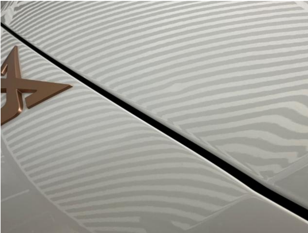
(33.) Beschreibung: 02