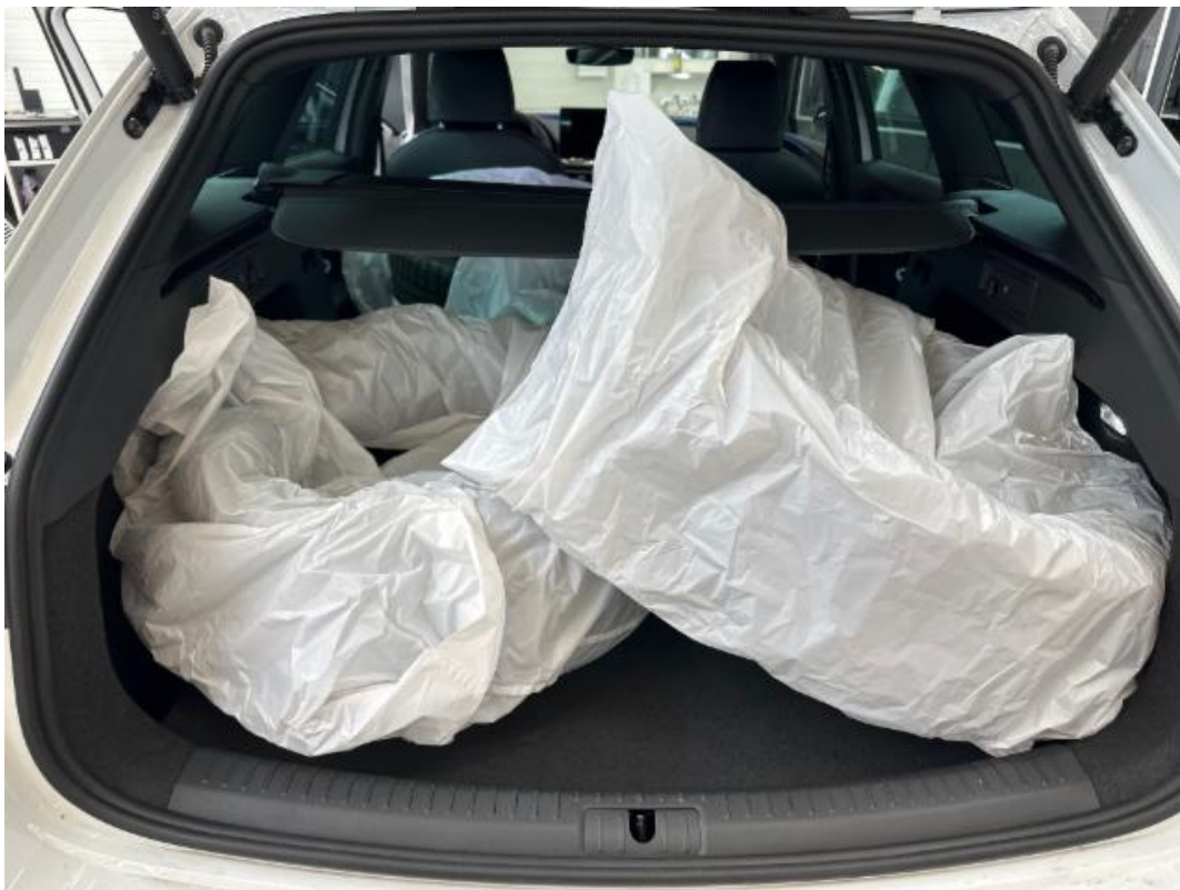
(12.) Beschreibung: h (Zusätzliche Räder im Kofferraum (nicht immer vorhanden))