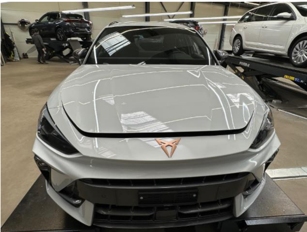
(2.) Beschreibung: aa (Front)