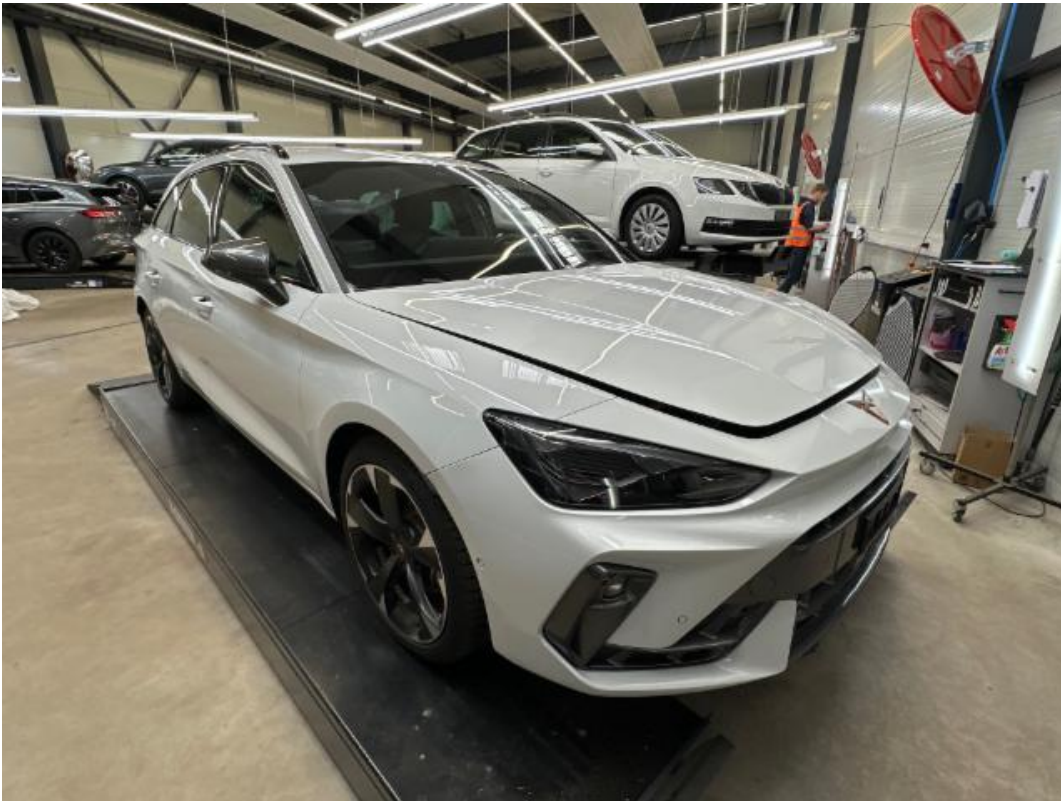
(1.) Beschreibung: a (Diagonal vorne rechts – ganzes Fahrzeug)