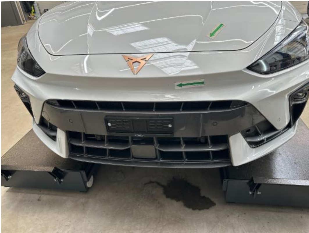
(29.) Beschreibung: 01