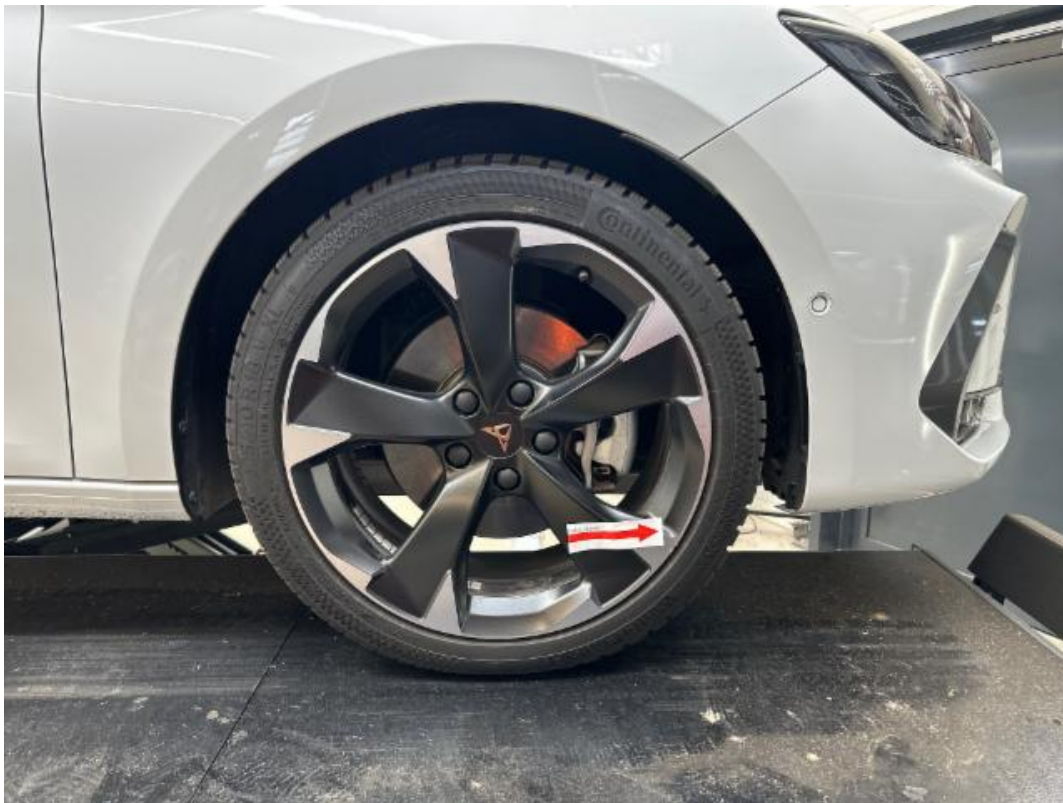
(25.) Beschreibung: 08