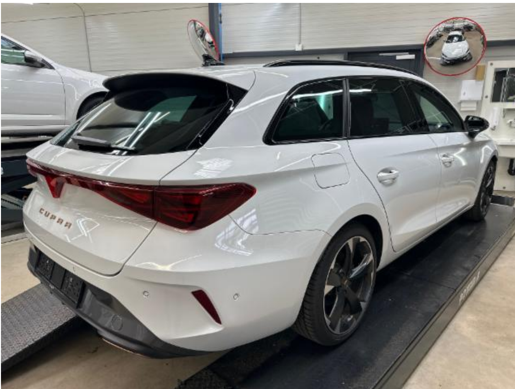
(6.) Beschreibung: d (Diagonal hinten rechts – ganzes Fahrzeug)