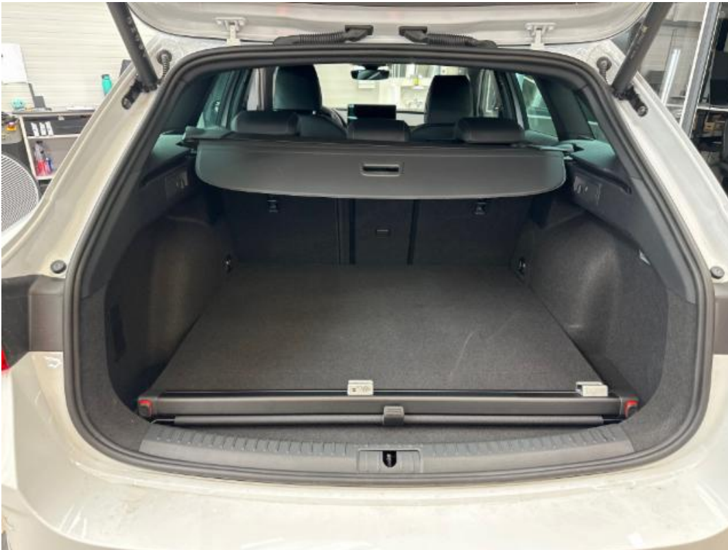
(17.) Beschreibung: o (Kofferraum geöffnet/Ladefläche - Abdeckung geöffnet)