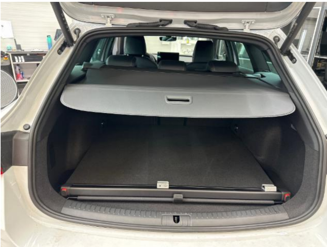
(16.) Beschreibung: n (Kofferraum geöffnet/Ladefläche - Abdeckung geschlossen)