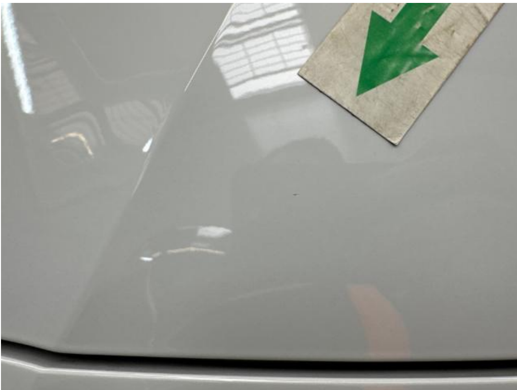
(32.) Beschreibung: 02