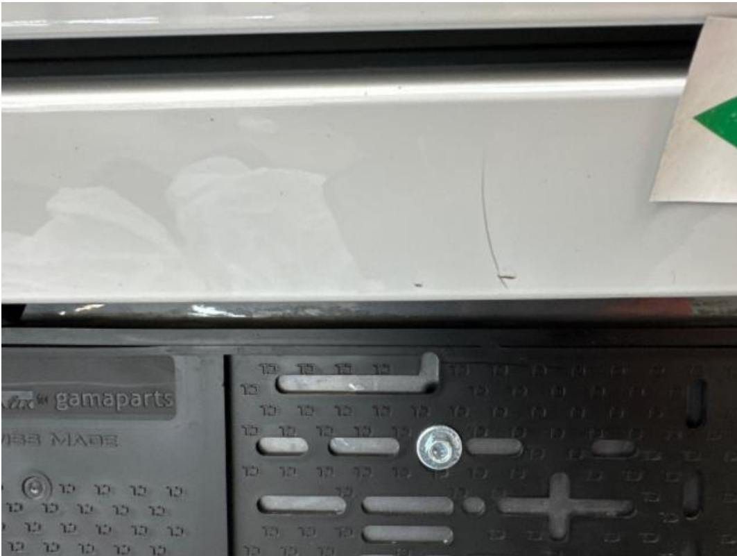
(35.) Beschreibung: 27