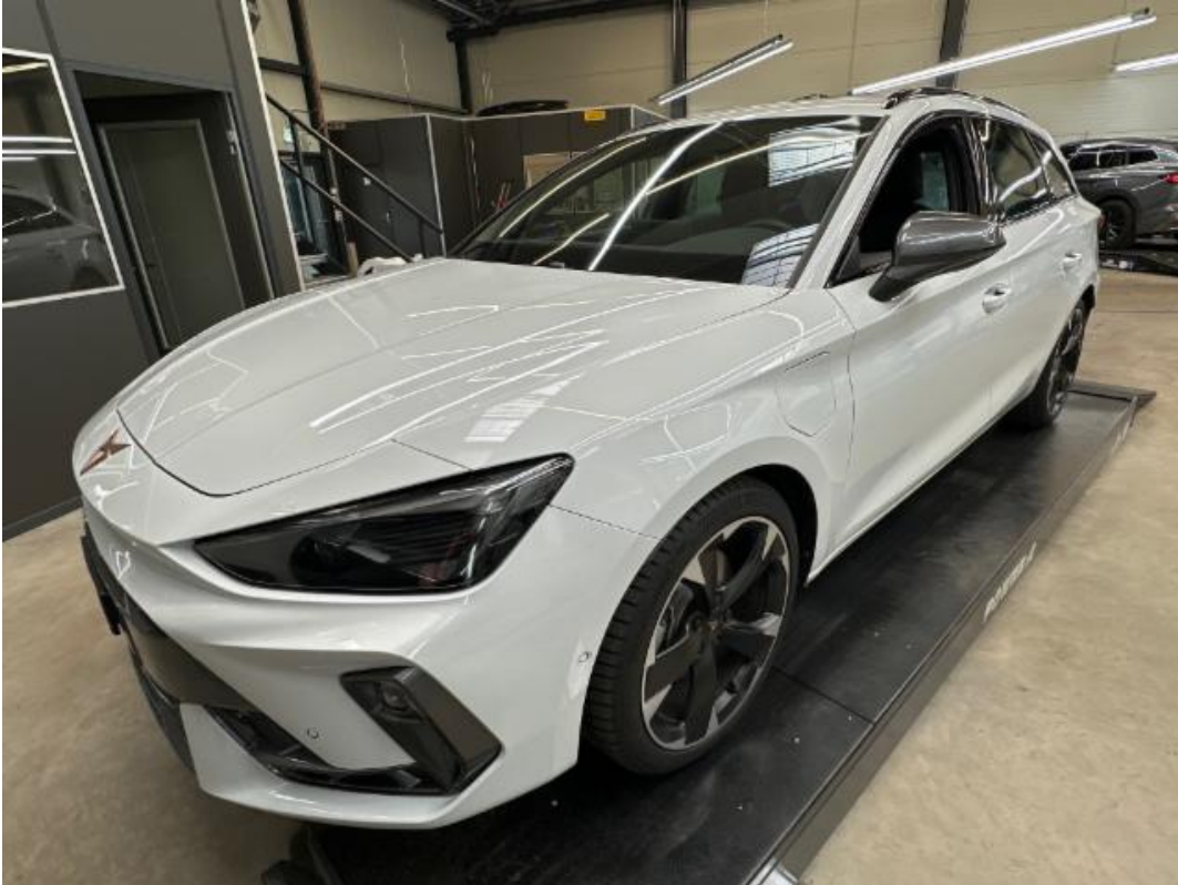
(3.) Beschreibung: b (Diagonal vorne links – ganzes Fahrzeug)