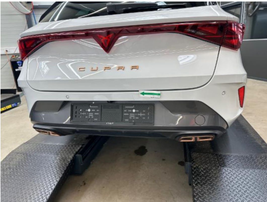
(34.) Beschreibung: 27