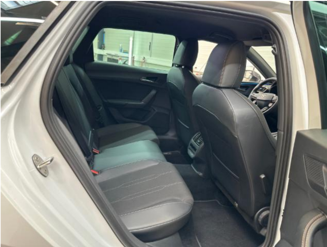
(19.) Beschreibung: r (Türöffnung hinten rechts)