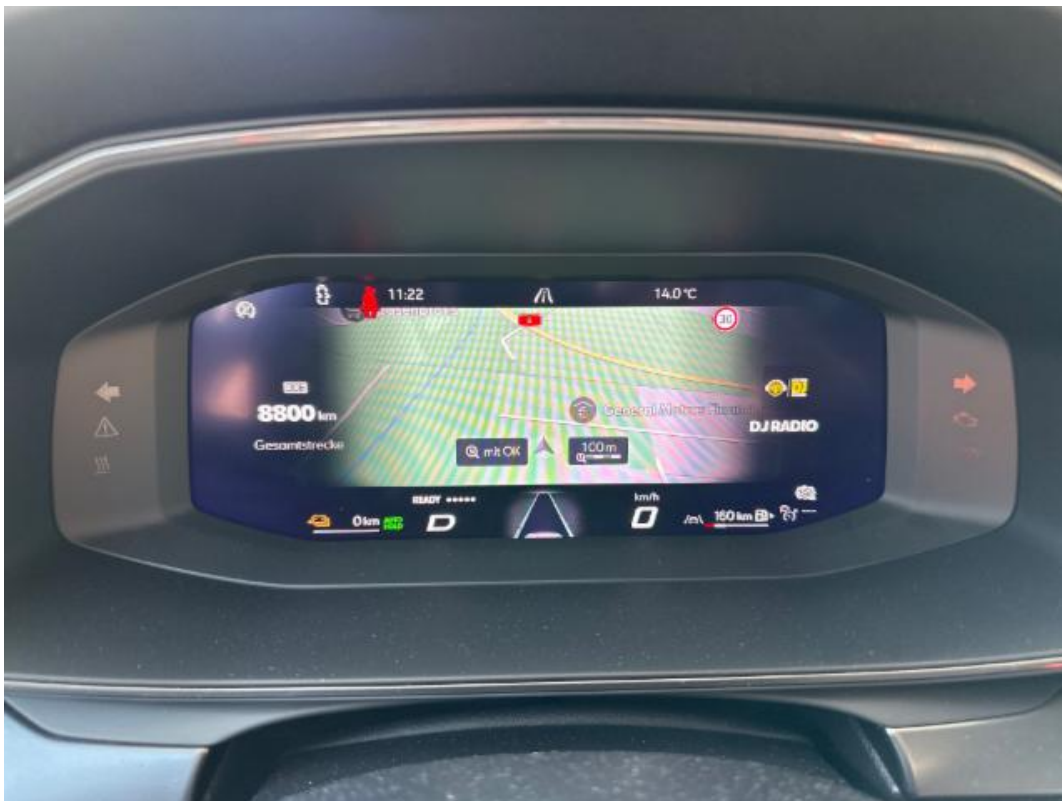
(8.) Beschreibung: f (Armaturenbrett/Kilometerstand bei laufendem Motor)