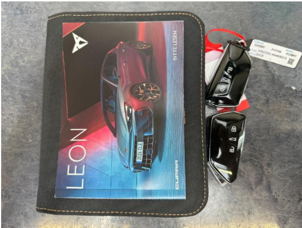
(11.) Beschreibung: g2 (Bordpapiere/Schlüssel/Serviceheft/SD-Karte/Navi CD)(2)