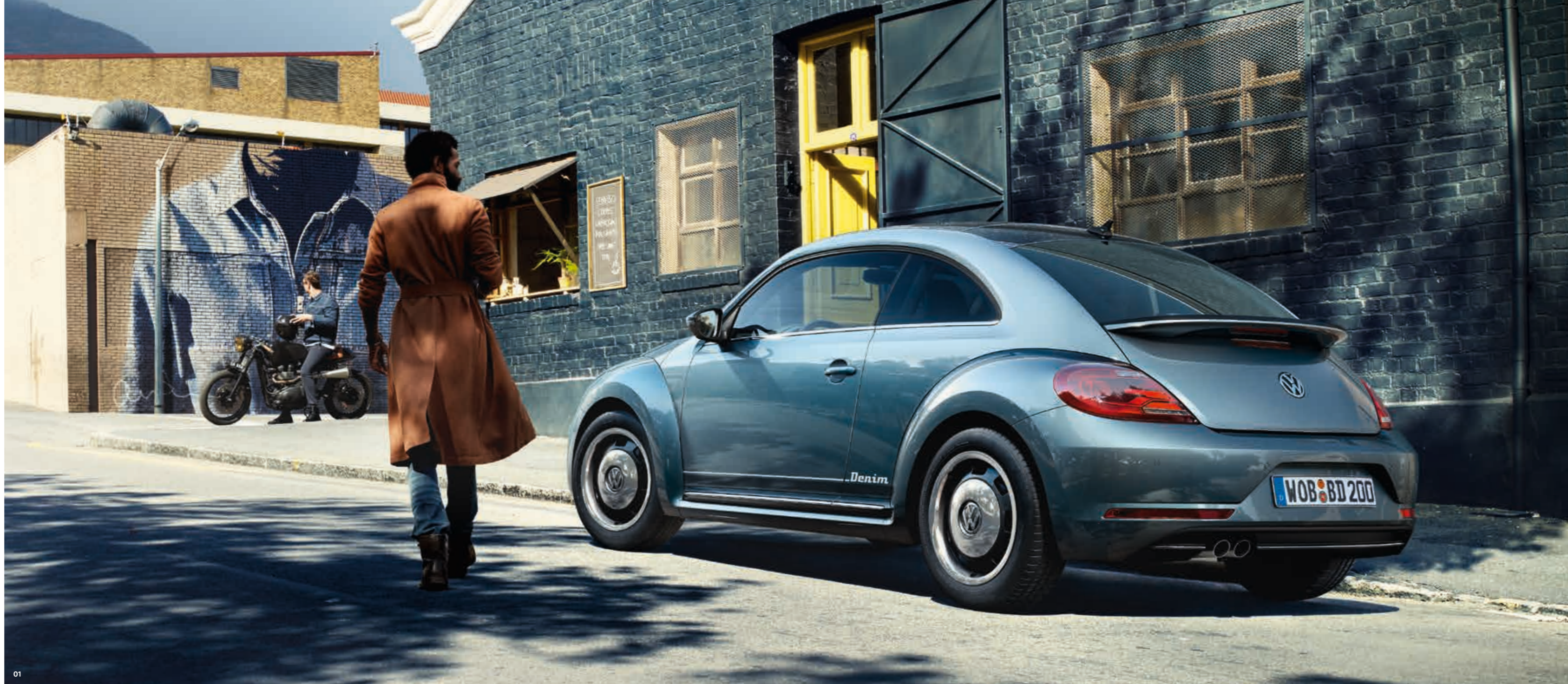
Abbildung 01 zeigt Ausstattungslinie „Design“.

01 Von außen tritt der neue Beetle Denim serienmäßig mit den 17-Zoll-Leichtmetallfelgen „Circle“ in Dark Graphite Metallic mit Chromkappe auf. Die Seitenbeplankung, die Türgriffe und die Außenspiegelkappen sind in Wagenfarbe gehalten. Eine Folienbeklebung mit Schriftzug „Denim“ über der Seitenbeplankung kennzeichnet den neuen Beetle Denim als Haute Couture unter den Sondermodellen. S